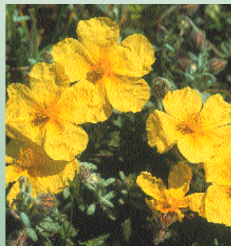
Ηλιάνθεμον το αμβλύφυλλον