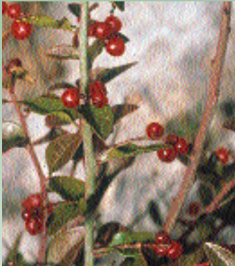
Μποζέα η κυπρία