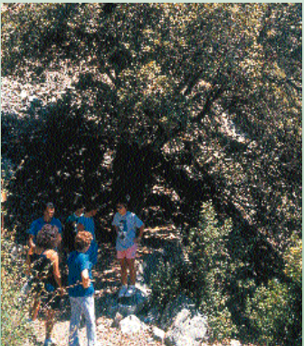
Δρυς η κληθρόφυλλη