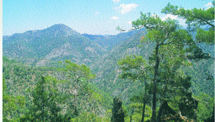
Δάσος Πεύκης Τραχείας (Μαύροι κρεμμοί - Κύκκος)

Σήμερα τα δάση και οι δασικές εκτάσεις περιορίζονται κυρίως στα βουνά του Τροόδους και του Πενταδακτύλου. Μικρότερες δασικές εκτάσεις βρίσκονται είτε στους πρόποδες των δυο οροσειρών είτε σε πεδινές και ημιορεινές περιοχές. Έχουν έκταση 2.293,711 km² (η έκταση της Κύπρου είναι 9.254,480 km²). Σε γενικές γραμμές, μπορούμε να τα διακρίνουμε σε τέσσερις κατηγορίες: α) φυσικά πευκοδάση, β) αναδασώσεις / δασώσεις κυρίως με πεύκη τραχεία, γ) ψηλούς και χαμηλούς θαμνώνες, φρύγανα και λιβαδικές διαπλάσεις, και δ) γυμνές εκτάσεις - φράχτες, μεταλλεία κτλ. Για σκοπούς διαχείρισης χωρίζονται σε δυο μεγάλες κατηγορίες: τα κύρια και τα δευτερεύοντα δάση.