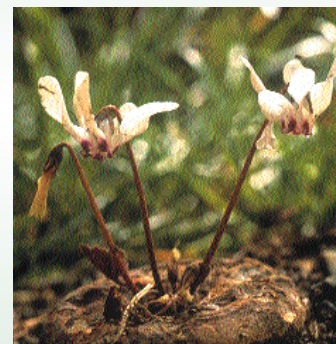
Κυκλάμινον το κύπριον