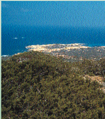
Άρκευθος η φοινικική