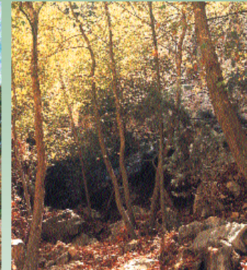
Κυπάρισσος η αιθαλής