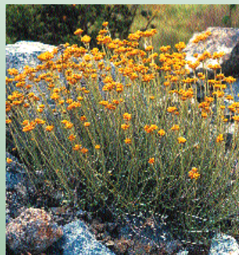
Ηλίχρυσον το σφαιρικό