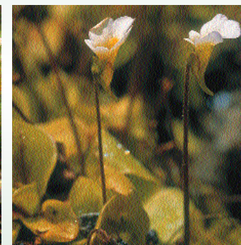
Πιγκουικούλα η κρυστάλλινη

Πολυτετές το οποίο απαντά σε υγρότοπους σε υψόμ. μέχρι 1.600 m.