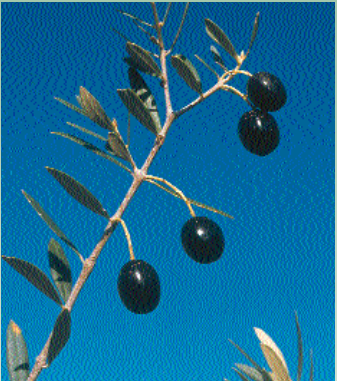
Ελιά η ευρωπαϊκή