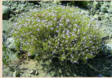
Thymus capitatus (Θυμάρι)

Αειθαλής θάμνος που απαντά μόνο στην ανατολική Μεσόγειο και στα Βαλκάνια μέχρι τον Καύκασο. Αρκετά κοινός στην Κύπρο στη ζώνη 600-1400 m (και σε ορισμένες περιοχές μέχρι 100 m).