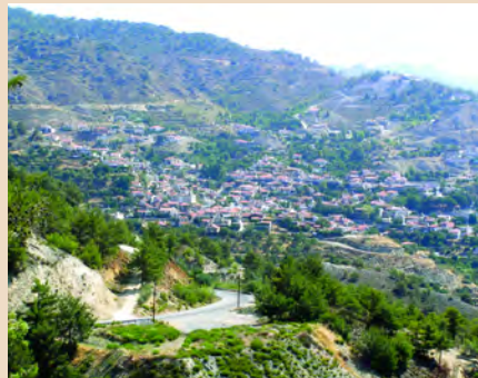
Πανοραμική άποψη του χωριού Πελενδρι

Προσφέρει επίσης ωραία θέα από την πλευρά του Πελενδρίου προς τα χωριά Άγιος Ιωάννης και Άγιος Θεόδωρος Αγρού, προς τον κόλπο της Λεμεσού και από την πλευρά των Φυλάγρων προς τις νότιες πλαγιές του Δάσους Τροόδου, ιδιαίτερα την περιοχή Μέσα Ποταμού.