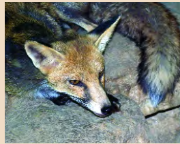
Vulpes vulpes indutus

Σκαντζόχοιρος ( Hemiechinus auritus dorotheae )