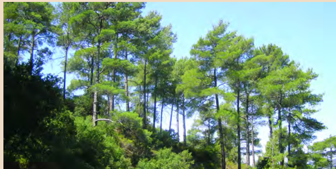
Συστάδα τραχείας πεύκης

Η βλάστηση στο μεγαλύτερο μέρος του μονοπατιού είναι ομοιόμορφη και αποτελείται από φυσικό πευκοδάσος τραχείας πεύκης ( Pinus brutia ) με υπόροφο ξισταρκάς ( Cistus creticus & Cistus salviifolius ).