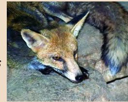
Vulpes vulpes indutus

Σκαντζόχοιρος ( Hemiechinus auritus dorotheae )