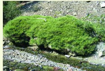
Ρασιήν του Τροόδους

Η βλάστηση στην αρχή του μονοπατιού αποτελείται από σχετικά ομοιόμορφο φυσικό δάσος τραχείας πεύκης ( Pinus brutia ), με υπόροφο ξισταρκάς ( Cistus creticus & Cistus salvifolius ). Σημαντική είναι και η παρουσία της ενδημικής λιατζίνας ( Quercus alnifolia ), της τρεμιθιάς ( Pistacia terebinthus ), της στερατζιάς ( Styrax officinalis ) και της αντρουκλιάς ( Arbutus andrachne ).