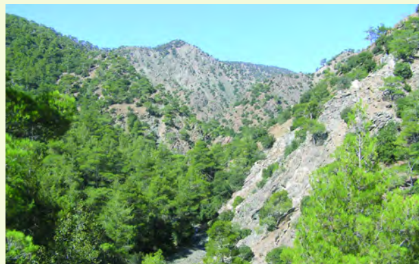
Φυσικό πευκοδάσος τραχείας πεύκης

Η κλίση του μονοπατιού είναι σχετικά ομαλή, αλλιά στα σημεία που διασταυρώνει τον ποταμό χρειάζεται ιδιαίτερη προσοχή, κυρίως την άνοιξη, όταν το νερό είναι περισσότερο. Κατά τη χειμερινή περίοδο και νωρίς την άνοιξη, το τμήμα του μονοπατιού κατά μήκος του ποταμού είναι αδιάβατο. Το μονοπάτι έχει ανώτατο υψόμετρο 1.110 m και κατώτατο 1.010 m. Το μεγαλύτερο μέρος του μονοπατιού αποτελεί μέρος παλιάς διαδρομής που χρησιμοποιούσαν οι εργάτες του μεταλλείου Αμιάντου προς τα γύρω χωριά.