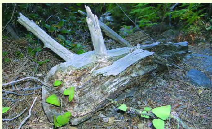
Ξύλο σε αποσύνθεση