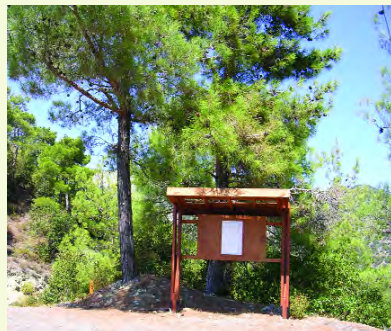
Σημείο εκκίνησης - Πληροφορίες

Είναι γραμμικό μονοπάτι μήκους 2 km, με χρόνο πορείας 0,5-1 ώρα. Αρχίζει από αγροτικό δρόμο στο χωριό Κάτω Αμιάντος και περνά διαμέσου πυκνού δάσους, καταλήγοντας στον ποταμό των «Λουμάτων». Από εκεί ακολουθεί πορεία κατά μήκος του ποταμού και τελειώνει