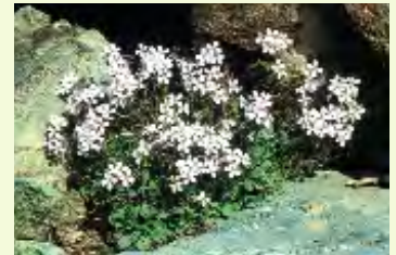
Κλάματα της Παναγίας