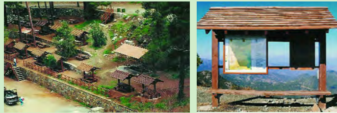
Εκδρομικός χώρος φράκτη Ξυλιάτου Μονοπάτι Μελέτης της Φύσης

Οι διευκολύνσεις δασικής αναψυχής στο δάσος Αδελφοί περιλαμβάνουν εκδρομικούς χώρους και Μονοπάτια Μελέτης της Φύσης που φαίνονται σε πίνακα και χάρτη στο τέλος του φυλλαδίου.