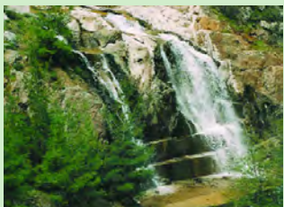
Υπερχείλιση του υδατοφράκτη

χωρητικότητα 1.690.000m 3 νότια του χωριού, η εξωποτάμια υδατοδεξαμενή Λαγουδερών (70.000m 3 ) και ο μικρός υδατοφράκτης Καλού Χωριού Κλήρου (32.000m 3 ). Τέλος, νότια του δάσους Αδελφοί, ταξιδεύοντας από τον Άγιο Επιφάνιο προς το Φαρμακά βρίσκεται ο υδατοφράκτης Φαρμακά ή Παλαιχωριού με χωρητικότητα 620.000m 3 .