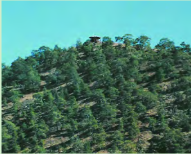
Δασικό Πυροφυλάκιο, “Κακός Άνεμος”