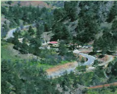
Δασικός Σταθμός, Γεφύρι της Παναγιάς

Αξίζει να σημειωθεί ότι τους θερινούς μήνες λειτουργούν τρία πυροφυ-