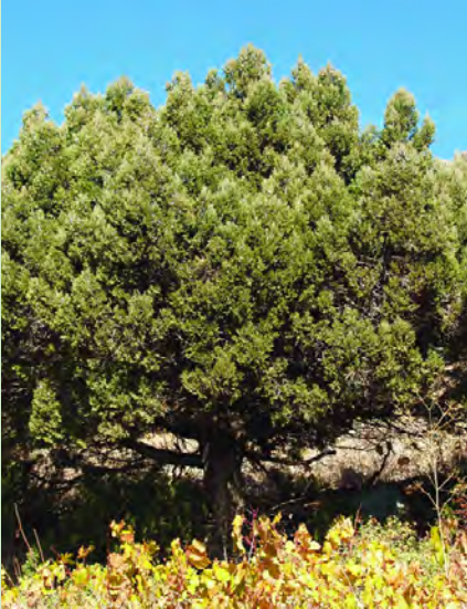
Άρκευθος η υψηλή - Juniperus excelsa

Ψηλότερα, γύρω στα 800m κάνει την εμφάνισή της η αντρουκλιά ( Arbutus andrachne ) στους καλύτερους τόπους, και ακόμα πιο ψηλά εμφανίζεται και η αγριοτριανταφυλλιά ( Rosa canina ) και η