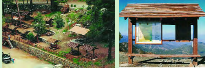
Εκδρομικός χώρος φράκτη Ξυλιάτου Μονοπάτι Μελέτης της Φύσης

Οι διευκολύνσεις δασικής αναψυχής στο δάσος Αδελφοί περιλαμβάνουν εκδρομικούς χώρους και Μονοπάτια Μελέτης της Φύσης που φαίνονται σε πίνακα και χάρτη στο τέλος του φυλλαδίου.