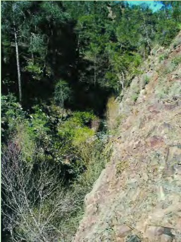
Πετρώματα του δάσους Αδελφοί