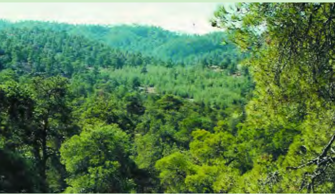
Συστάδα Τραχείας Πεύκης (Pinus brutia)

Παρόλο που το κλίμα σε ολόκληρη την έκταση του δάσους Αδελφοί είναι μεσογειακό, παρατηρούνται αισθητές διαφορές μεταξύ περιοχών με ψηλά και χαμηλά υψόμετρα. Έτσι, στην κορυφογραμμή Μαδαρή – Κυπερούντα – Σπήλια οι βροχές το χειμώνα είναι πιο πολλές και η μέση ετήσια βροχόπτωση φτάνει τα 800mm, οι θερμοκρασίες του καλοκαιριού είναι πιο χαμηλές, με τις μέγιστες να μην ξεπερνούν τους 32 – 33°C, οι χειμώνες είναι πιο κρύοι με νυχτερινούς παγετούς που φτάνουν τους -10°C και με χιόνια, έστω και λίγα, κάθε χρόνο. Επίσης, παρατηρείται βροχόπτωση και σε μερικές μέρες του καλοκαιριού. Τα αντίστοιχα κλιματολογικά στοιχεία για την πιο ξηροθερμική ζώνη που είναι αυτή του Ατσά – Νικηταρίου – Αγίας Μαρίνας Ξυλιάτου είναι: βροχόπτωση 330mm, μέγιστες ημερήσιες καλοκαιρινές θερμοκρασίες που φτάνουν ή ξεπερνούν τους 40°C και σπάνιους