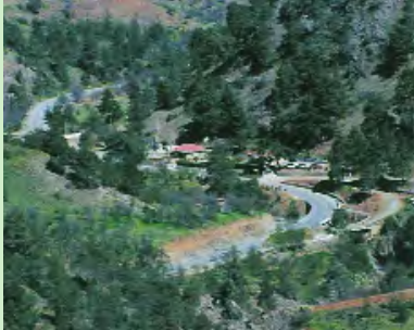
Δασικός Σταθμός, Γεφύρι της Παναγιάς

Αξίζει να σημειωθεί ότι τους θερινούς μήνες λειτουργούν τρία πυροφυ-