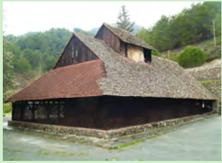
Εκκλησία Παναγίας του Άρακα (Λαγουδερά)

Οι υδατοφράκτες αποτελούν ένα άλλο σημαντικό στοιχείο των τοπίων του δάσους. Ο κυριότερος υδατοφράκτης είναι του Ξυλιάτου που βρίσκεται δυτικά του χωριού, δίπλα από το δασικό εκδρομικό χώρο. Η χωρητικότητά του είναι 1.430.000m 3 . Αποτελεί βίοτοπο για το νερόφιδο ( Natrix natrix ) γι' αυτό και το ψάρεμα απαγορεύεται ολόχρονα. Επίσης, αναφέρονται ο υδατοφράκτης Βυζακιάς με