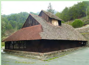
Εκκλησία Παναγίας του Άρακα (Λαγουδερά)

Οι υδατοφράκτες αποτελούν ένα άλλο σημαντικό στοιχείο των τοπίων του δάσους. Ο κυριότερος υδατοφράκτης είναι του Ξυλιάτου που βρίσκεται δυτικά του χωριού, δίπλα από το δασικό εκδρομικό χώρο. Η χωρητικότητά του είναι 1.430.000m 3 . Αποτελεί βίοτοπο για το νερόφιδο ( Natrix natrix ) γι' αυτό και το ψάρεμα απαγορεύεται ολόχρονα. Επίσης, αναφέρονται ο υδατοφράκτης Βυζακιάς με