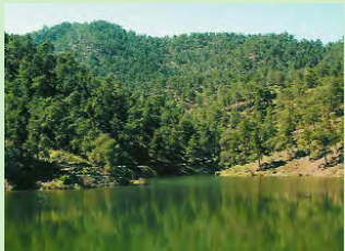
Υδατοφράκτης Αγ. Μαρίας, Ξυλιάτου