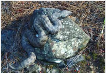
Το Malpolon monspessulanus είναι το μεγαλύτερο είδος φιδιών που απαντάται στην Κύπρο.

σχεδόν όλα τα φίδια, τρέπεται σε φυγή. Τα ζώα που προσβάλλονται από το δηλητηρίο του πεθαίνουν πολύ γρήγορα ενώ αν ο άνθρωπος δαγκωθεί, υποφέρει από δυσάρεστες συνέπειες, όπως οδυνηρό φούσκωμα και συγχρόνως βαρύ πονοκέφαλο.