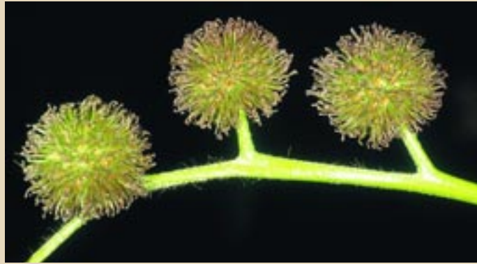
ΠΛΑΤΑΝΟΣ Platanus orientalis