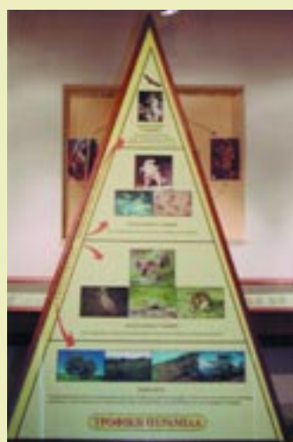
Αναπαράσταση της τροφικής πυραμίδας Representation of food pyramid