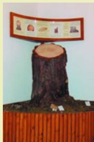
Κορμούς τραχείας πεύκης Calabrian pine's stem