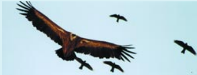
Ο Γύπας ( Gyps fulvus )

Η πανίδα της χερσονήσου είναι λιγότερο γνωστή απ' ό,τι η χλωρίδα γιατί δυστυχώς δεν έχει εκπονηθεί μέχρι στιγμής οποιαδήποτε