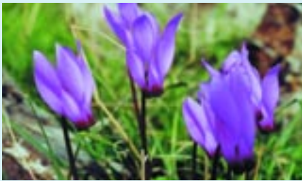
Κυκλάμινο ( Cyclamen persicum )

Η σπανιότητα των ενδημικών φυτών όπως η Tulipa cypria , το Alyssum akamasicum , η Bosea cypria , η Balloba integrifolia , η Salvia cypria , η Centaurea akamantis , η Centaurea veneris , το Phlomis cypria var. occidentalis και άλλων, η μεγάλη ποικιλία ορχιδέων όπως η Dactylorhiza romana , η Ophrys apifera , η Orchis coriophora και η Neotinea maculata και οι ποικίλες μορφές με τις οποίες παρουσιάζεται η μακία βλάστηση, μαζί με τις συστάδες της τραχείας πεύκης, καθιστούν το δάσος Ακάμα σπάνιο βίοτοπο της χλωρίδας με μεγάλη οικολογική και επιστημονική αξία. Σχετικά ανεξερεύνητη παραμένει η θαλάσσια χλωρίδα.