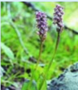
Ορχιδέα ( Neotinea maculata )

Η δασική βλάστηση συνίσταται κυρίως από τον Αόρατο ( Juniperus phoenicia ) και την Τραχεία πεύκη ( Pinus brutia ). Πολλοί θάμνοι, όπως η σχινιά ( Pistacia lentiscus ), η κουμαριά ( Arbutus andrachne ), η αγριο-χαρουπιά ( Ceratonia siliqua ), η αγριελιά ( Olea europaea ), η τρεμιθιά ( Pistacia terebinthus ), η περνιά ( Quercus coccifera ), η δάφνη ( Laurus nobilis ), η μερσινιά ( Myrtus communis ), η σφενταμιά ( Acer obtusifolium ) κ.λ.π. και μια πληθώρα από φρύγανα και ποώδη ετήσια φυτά συνθέτουν μια πλούσια πυκνή βλάστηση που καλύπτει σχεδόν ολοσχερώς το τοπίο.