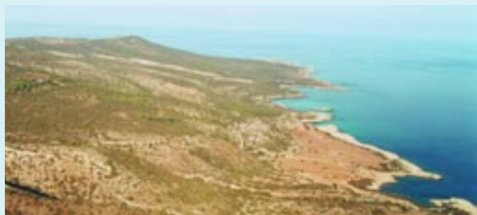
Πανοραμική θέα μέρους της χερσονήσου του Ακάμα

Το κράτος προωθεί την κήρυξη της χερσονήσου του Ακάμα σε Εθνικό Πάρκο, με κύριο συστατικό τα Κρατικά Δάση της χερσονήσου, στη βάση μιας ενιαίας μελέτης.