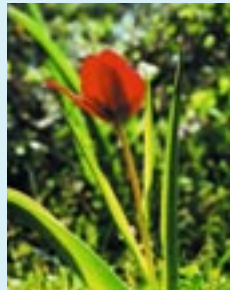
Τουλίπα ( Tulipa cypria )