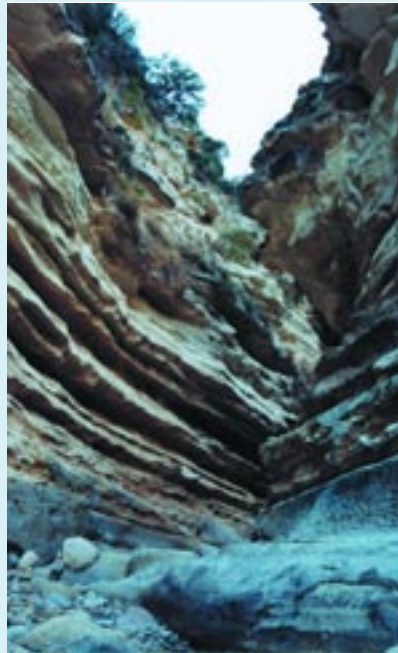
Το Φαράγγι των Κουφάων

Η ανάμιξη των πιο πάνω πετρωμάτων με διαβασικά πετρώματα και σερπεντίνη δημιουργεί συνθήκες ανάπτυξης πολύ σπάνιων φυτών σε τεράστια ποικιλία οικοτόπων. Η χερσόνησος του