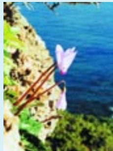
Κυκλάμινο ( Cyclamen cypricum )