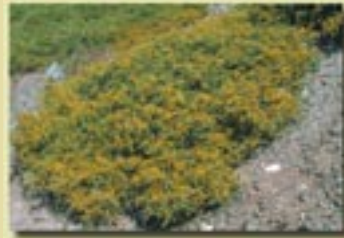
Genista sphacelata ssp. crudelis (Ρασιήν του Τροόδους)