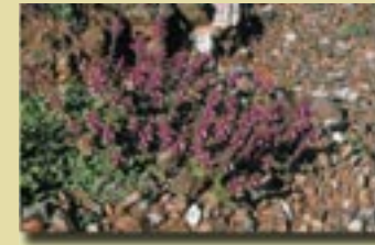
Scutellaria cypria var. cypria (Σκουτελλάρια η κυπριακή)