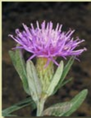
Jurinea cypria (Τζιουρινέα η κυπριακή)