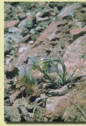
Onosma troodi (Ονόσμα του Τροόδους)