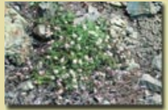
Anthemis plutonia (Ανθεμης του Τροόδους)