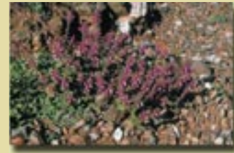
Scutellaria cyprica var. cyprica (Σκουτελλάρια η κυπριακή)