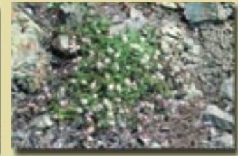
Anthemis plutonia (Ανθεμης του Τροόδους)