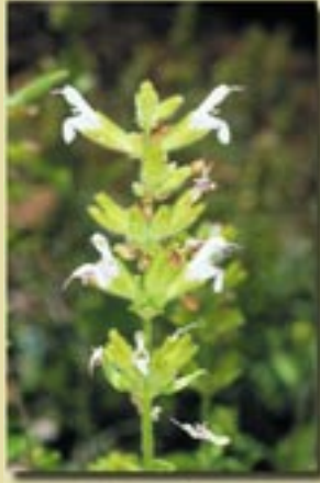
Salvia willeana (Σπατζιά του Τροόδους)