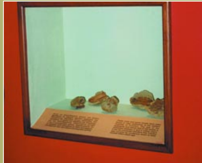
Έκθεμα με απολιθώματα Exhibit with fossils