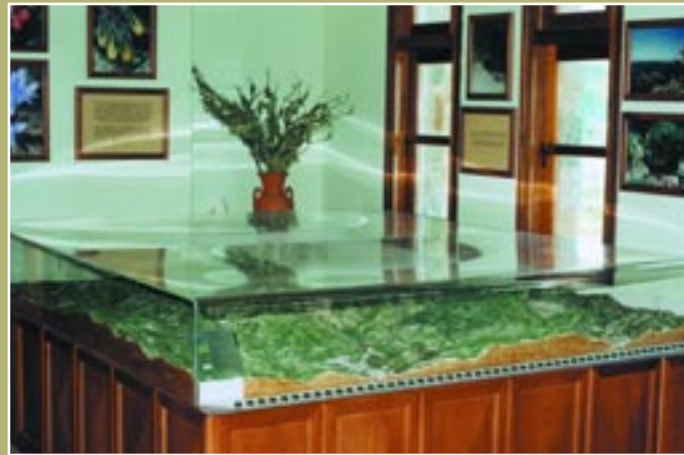
Μακέτα Εθνικού Δασικού Πάρκου Τροόδους Model of the Troodos National Forest Park