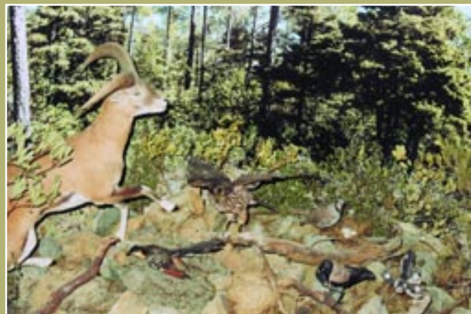
Διόραμα δάσους Τραχείας Πεύκης Diorama of brutia pina forest