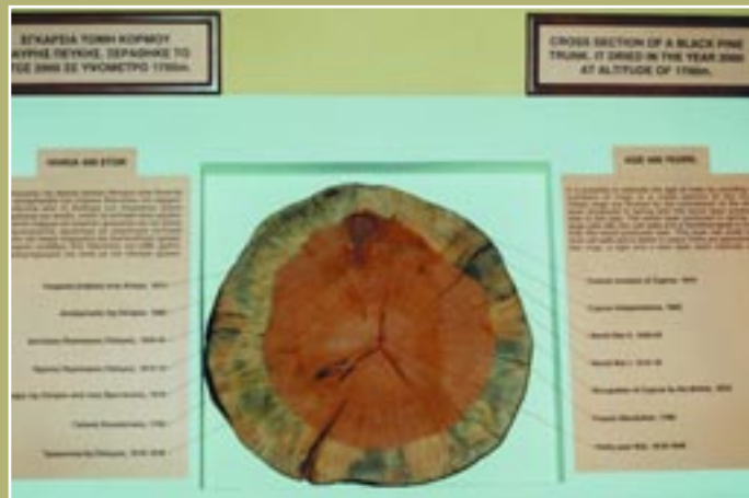
Τομή κορμού μαύρης πεύκης Cross section of a black pine trunk