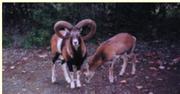
Το κυπριακό αγρινό ( Ovis gmelini ophion )

Ιστορικές μαρτυρίες (μωσαϊκά, κείμενα) αναφέρουν ότι το κυνήγι του αγρινού ήταν πολύ διαδεδομένο μέχρι τον προηγούμενο αιώνα και γίνονταν με σκύλους ή κυναιήτορες. Λόγω του κινδύνου εξαφάνισής του, το κυνήγι του έχει απαγορευτεί και το κυπριακό αγρινό είναι προστατευόμενο είδος. Σήμερα υπολογίζεται ότι υπάρχουν πέραν των 2.000 ζώων στο δάσος Πάφου.