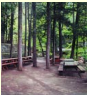
Εκδρομικός χώρος Σταυρού Ψώκας

Ο επισκέπτης του δάσους Πάφου έχει την ευκαιρία να απολαύσει και να θαυμάσει τις φυσικές και ανεπανάληπτες ομορφιές των δασικών οικοσυστημάτων, να αναζωογονηθεί και ηρεμήσει στο ιδιαίτερο ενδοδασικό περιβάλλον, να μελετήσει, να εμπνευστεί και να ασκηθεί ακολουθώντας τα μονοπάτια της φύσης, να διασκεδάσει και να απολαύσει το φαγητό του, να ξεφύγει από τη μονοτονία και ένταση της καθημερινής ζωής και να βρεθεί στο απόλυτα καθαρό περιβάλλον απαλλαγμένο από κάθε ρύπανση. Η επαφή του επισκέπτη με τα στοιχεία του δάσους θα χαρίσει σ' αυτόν αξέχαστες εμπειρίες. Οι επισκέπτες του δάσους Πάφου αυξάνονται από χρόνο σε χρόνο, γι' αυτό το Τμήμα Δασών, σε συνεργασία και με άλλες Υπηρεσίες, έχει προχωρήσει στην κατασκευή και συνεχίζει να κατασκευάζει αριθμό εκδρομικών και κατασκηνωτικών χώρων και μονοπατιών μελέτης της φύσης. Η ύπαρξη ξενώνα και μικρού εστιατορίου στο Σταυρό της Ψώκας εξυπηρετούν τους επισκέπτες που θέλουν να διανυκτερεύσουν και να απολαύσουν τις φυσικές ομορφιές του δάσους.