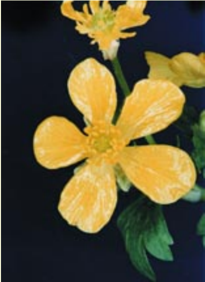
Ranunculus kykkoensis Ρανούγκουλος του Κύκκου

ρο ενδημικό θηλαστικό της Κύπρου, ζει και αναπαράγεται σε ιδιαίτερους βιότοπους του δάσους. Η παρουσία της αλεπούς ( Vulpes vulpes indutus ), του λαγού ( Lepus europaeus cyprius ), του σκαντζόχοιρου ( Hemiechinus auritus ssp. dorotheae ) και αρκετών σημαντικών ειδών πουλιών όπως οι σπάνιοι και προστατευόμενοι αετοί ( Aquila heliaca , Hieraaetus fasciatus ), ο γύπας ( Gyps fulvus ), το ανδόνι ( Luscinia megarhynchos ), το άνθρωποπούλι ( Tyto alba ), το θουπί ( Otus scops cyprius ), αρκετά είδη κουκουβάγιων, η πέρδικα ( Alectoris chukar ), η φάσσα ( Columba palumbus ) και το τρυγόνι ( Streptopelia turtur ) μαζί με διάφορα είδη φιδιών και σαυρών, κοίλοπτέρων και σπάνιων πεταλούδων συνθέτουν μια πλούσια πανίδα μεγάλης οικολογικής σημασίας για τον τόπο.