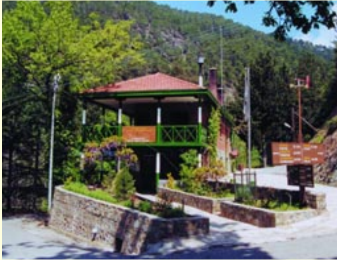
Κεντρικά Γραφεία Δασικής Περιφέρειας Πάφου στο Σταυρό Ψώκας

Η διοίκηση και διαχείριση του δάσους είναι αρμοδιότητα του Τμήματος Δασών του Υπουργείου Γεωργίας, Φυσικών Πόρων και Περιβάλλοντος. Στο δασικό σταθμό Σταυρού Ψώκας βρίσκεται η κεντρική διοίκηση του δάσους. Δασικοί σταθμοί υπάρχουν στα χωριά Κάμπος, Παναγιά, Γιαλιά, Μηλικούρι, Άγιος Νικόλαος, Γεροσκήπου, Κανναβιού, Λυσός, Πωμός, Κάτω Πύργος και στην Ιερά Μονή Κύκκου. Για αποτελεσματική διοίκηση και διαχείριση των δασικών πόρων το δάσος Πάφου χωρίζεται σε έντεκα (11) κοιλάδες· οι κοιλάδες Διαρίζου (Πηλατός), Ρούδια, Αγιάς, Σταυρού της Ψώκας, Αγίου Μερκουρίου, Γιαλιάς, Λειβαδιού, Φλέγιας, Λιμνίτη, Κάμπου και Ξερού. Οι κύριες δασικές δραστηριότητες είναι η προστασία του δάσους από τις πυρκαγιές, η σχεδίαση, βελτίωση και συντήρηση εκδρομικών και κατασκηνωτικών χώρων, μονοπατιών μελέτης της φύσης και του δασικού οδικού δικτύου, η διαχείριση και περιποίηση των δασικών συστάδων και δασικών βιοτόπων ή αναδάσωση γυμνών εκτάσεων, η παραγωγή δασικών δενδρυλλίων, ο σχεδιασμός, η φύτευση και περιποίηση δεντροστοιχιών και χώρων πρασίνου, η διατήρηση και προστασία της άγριας ζωής κ.λ.π.