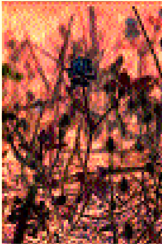
Trifolium campestre. ssp. paphium Τριφύλλι το πεδινό υποείδος πάφιο