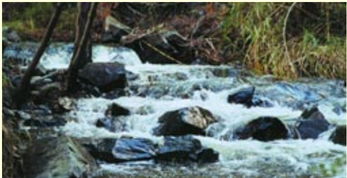
Ποταμός του Πωμού

Το υδρογραφικό δίκτυο του δάσους Πάφου είναι αποτέλεσμα της κατανομής της βροχόπτωσης, των γεωμορφολογικών συνθηκών και των πετρωμάτων που υπάρχουν. Μπορεί να χαρακτηριστεί σαν ακτινωτό με τους ποταμούς να κατευθύνονται από την ψηλότερη κορυφή, τον Τρίπυλο, προς την περιφέρεια του δάσους. Οι σημαντικότεροι ποταμοί είναι ο Διαρίζος, ο Ρούδιας, της Αγιάς, του Σταυρού της Ψώκας, του Αγίου Μερκουρίου, της Φλέγιας, του Λιμνίτη και του Ξερού. Ο Διαρίζος μαζί με το Ρούδια έχουν όλο το χρόνο νερό και αποτελούν την κύρια πηγή εμπλοτισμού των υπόγειων υδροφόρων στρωμάτων των κοιλάδων που διασχίζουν. Η ύπαρξη πλούσιων υδροφόρων στρωμάτων προσδίδει στο δάσος Πάφου μεγάλη υδρολογική αξία. Ένας σημαντικός αριθμός πηγών υδροδοτούν 47 παραδασόβια χωριά. Τα κύρια υδατικά