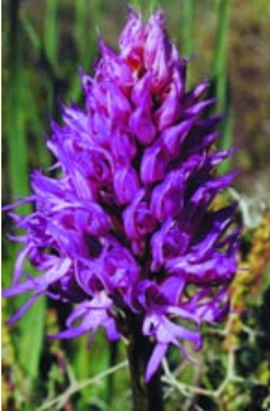
Orchis italica (Orchιδέα)

Τα είδη των φυτών που απαντώνται στο δάσος Πάφου υποδηγίζεται ότι ξεπερνούν τα 600. Ανάμεσα τους πενήντα (50) ενδημικά της Κύπρου από τα οποία 4 συμπεριλαμβάνονται στη Σύμβαση της Βέρνης και 11 στον κατάλογο της Διεθνούς Ένωσης για Διατήρηση του Περιβάλλοντος (I.U.C.N.). Η ύπαρξη μεγάλου αριθμού orchιδέων όπως το Limodorum abortivum , η Orchis sancta , η Ophrys