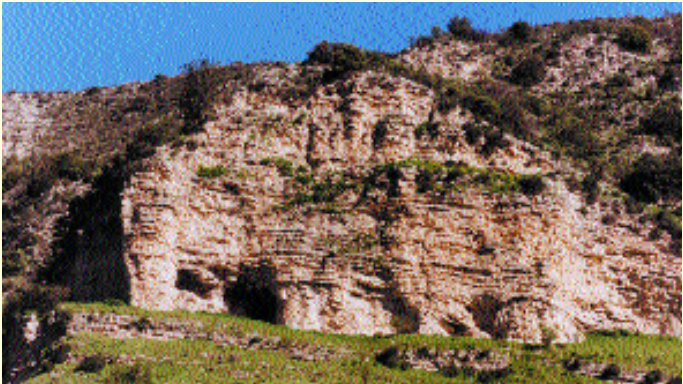
Γεωλογικός Σχηματισμός (από ασβεστολιθικά πετρώματα)

Το γεωλογικό υπόστρωμα του δάσους Πάφου αποτελεί μέρος