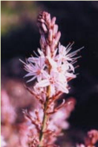
Asphodelus aestivus Ασφόδελος ο θερνός