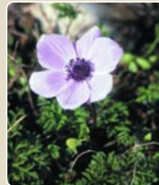
Ανεμόνη ( Anemone coronaria )

εδάφους, η ανθρώπινη επίδραση (πυρκαγιές, βόσκηση, ξύλευση) κλπ. Έτσι το μεγαλύτερο μέρος του δάσους είναι φυσικό και αναγεννάται από μόνο του, χωρίς την επέμβαση του ανθρώπου, ενώ σε μικρότερες εκτάσεις είναι τεχνητό, δηλαδή αναδασώσεις μετά από πυρκαγιές όπως στις περιοχές "Δρυς", "Μούττη του Κόρνου" και "Τουρκοπουλιέρης".