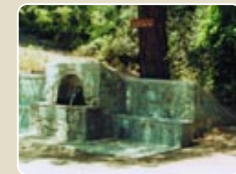
Βρύση του Πετρή

Ο υδρολογικός ρόλος του δάσους συνίσταται κυρίως στο φιλτράρισμα και καθάρισμα του νερού της βροχής και των χιονιών, στην αποθήκευση του στα υπόγεια