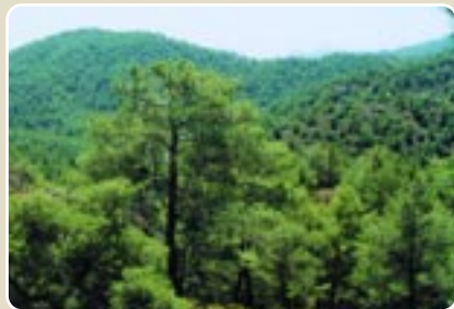
Δάσος Τραχείας Πεύκης ( Pinus brutia )

Στα ανατολικά επεκτείνεται μέχρι το χωριό Λυθροδόντας και την περιοχή Κυπροβάσας, στα νότια μέχρι το χωριό Βαβατσινιά, στα δυτικά μέχρι τα χωριά Φικάρδου, Λαζανιά και Γούρρι και τέλος στα βόρεια μέχρι τα χωριά Καπέδες και Φιλάνι.