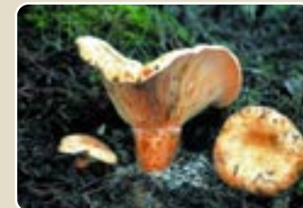
Κοκκινομανιτάρο ( Lactarius deliciosus )

Σε ρεματιές και υγρές περιοχές αναπτύσσονται υγρόφιλες φυτοκοινωνίες με κυρίαρχα είδη, τον πλάτανο ( Platanus orientalis ), το σκλέδρο ( Alnus orientalis ), τη δάφνη ( Laurus nobilis ), το σφένδαμνο ( Acer obtusifolius ), τη μερσιλιά ή μυρτιά ( Myrtus communis ), την πυκροδάφνη ή αροδάφνη ( Nerium oleander ), το βάτο ( Rubus sanctus ), τη μέντα ( Mentha longifolia ssp. cyprica ), κλπ.