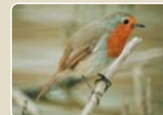
Κοκκινολαίμης ( Erithacus rubecula )

έχει εντοπισθεί μικρός βιότοπος όπου ζει και αναπαράγεται στο δάσος Μαχαιρά. Επίσης υπάρχουν διάφορα είδη ερπετών όπως φίδια και σαύρες, έντομα όπως κολεόπτερα και σπάνια ενδημικά είδη πεταλούδων που συνθέτουν μια σχετικά πλούσια πανίδα μεγάλης οικολογικής σημασίας για το νησί μας.