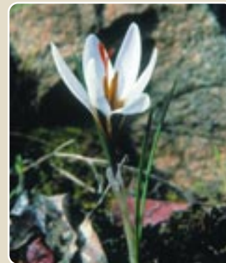
Ενδημικό είδος κρόκου ( Crocus hartmannianus )

Η ποικιλότητα που παρουσιάζει η βλάστηση στο δάσος Μαχαιρά είναι το αποτέλεσμα της διακύμανσης των οικολογικών και άλλων παραγόντων που επηρεάζουν την ανάπτυξη και τη διαμόρφωση των καταληκτικών φυτοκοινωνιών. Αυτοί οι παράγοντες είναι το υψόμετρο, η έκθεση και η κλίση του εδάφους που επηρεάζουν το τοπικό κλίμα (μικροκλίμα), το γεωλογικό υπόστρωμα και το βάθος του