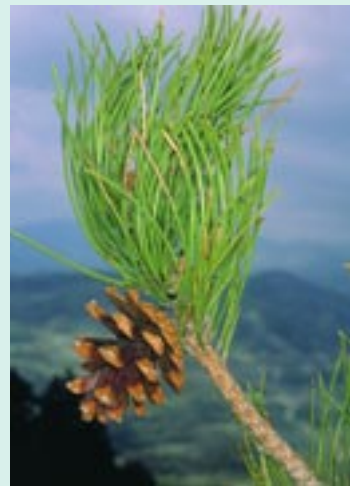
Pinus nigra ssp. pallasiana