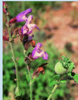
Salvia fruticosa - Σπατζιά ή Φασκομηλιά

Φυτό της ανατολικής Μεσογείου που στην Κύπρο είναι πολύ κοινό στα υψόμετρα 0 - 1.400m. Τα αποξηραμένα φύλλα της χρησιμοποιούνται στην παρασκευή τσαγιού.