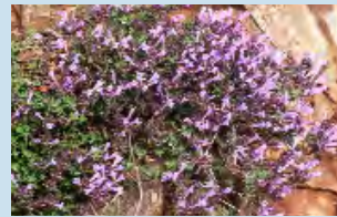
Thymus integer - Θρουμπί

Ενδημικός χαμηλός θάμνος που απαντά στη ζώνη 100 - 1.700m, σε πευκοδάση, μακκία βλάστηση και φρύγανα.