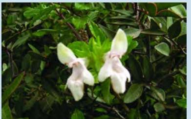
Prasium majus - Φασσόχορτο

Απαντά ανάμεσα σε θάμνους σε δάση “μακκί” από 0 - 500m υψόμετρο. Ανθίζει τον Ιανουάριο με Μάιο. Διαδεδομένο στη Μεσόγειο και τα νησιά του Ατλαντικού.