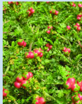
Sarcopoterium spinosum - Μαζίν

Κοινός θάμνος που απαντά κυρίως σε περιοχές με φρύγανα (υψομ. 0 - 1.000m)