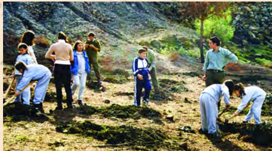
Δενδροφύτευση από σπουδαστές του Κολεγίου και μαθητές σχολείων στο Δάσος Κολεγίου

Οι σπουδαστές είναι οργανωμένοι σε σπουδαστικό σύνδεσμο, ο οποίος διαδραματίζει σημαντικό ρόλο στην κοινωνική, ψυχαγωγική και αθλητική ζωή του Κολεγίου.