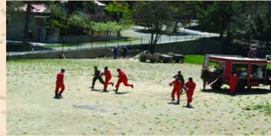
Πρακτική εξάσκηση στη χρήση του πυροσβεστικού οχήματος