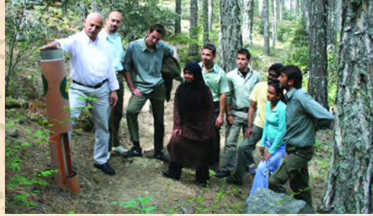
Πρακτική εξάσκηση σε πειραματική επιφάνεια για τη μέτρηση της ατμοσφαιρικής ρύπανσης

Το Δασικό Κολέγιο βρίσκεται στο χωριό Πρόδρομος της Επαρχίας Λεμεσού σε μια περιοχή που περιβάλλεται από πευκοδάσος, ιδανικό μέρος για την παροχή δασικής εκπαίδευσης. Το κλίμα της περιοχής είναι κατά το καλοκαίρι δροσερό και ξηρό, ενώ το χειμώνα ψυχρό.