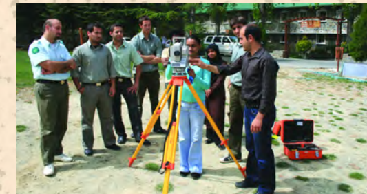
Χρήση του θεοδόλιχου

Ο Ανώτερος Εξαμηνιαίος Κύκλος Σπουδών οδηγεί στην απόκτηση του Ανώτερου Διπλώματος στη Δασοπονία. Το πρόγραμμα αυτό προσφέρεται μόνο σε ξένους σπουδαστές.