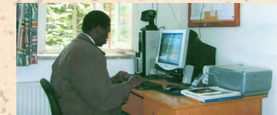
Ατομικό δωμάτιο σπουδαστή

Διαθέτει επίσης οικοτροφείο χωρητικότητας 35 δωματίων, στα οποία διαμένουν οι σπουδαστές, εστιατόριο, αίθουσα αναψυχής, γήπεδα ποδοσφαίρου, πετόσφαιρας και καλαθόσφαιρας.