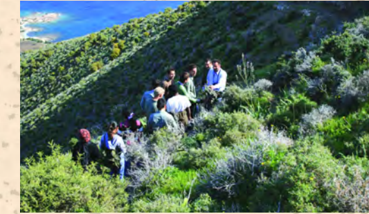
Συλλογή δειγμάτων για το μάθημα της Βοτανικής

Ο Μικρής Διάρκειας Κύκλος Σπουδών οδηγεί στην απόκτηση του Πιστοποιητικού στη Δασοπονία. Το πρόγραμμα αυτό προσφέρεται μόνο σε ξένους σπουδαστές.