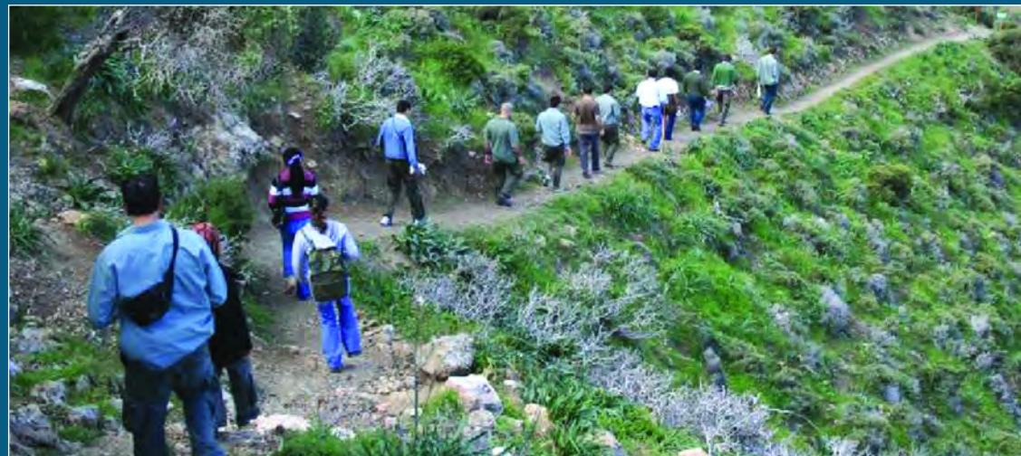
Σπουδαστές του Κολεγίου μαζί με σπουδαστές από Ε.Ε. στα πλαίσια των Ευρωπαϊκών προγραμμάτων Leonardo Da Vinci και Socrates Erasmus.

Οι κάτοχοι του Διπλώματος στη Δασοπονία, συνήθως γίνονται δεκτοί για περαιτέρω σπουδές σε πανεπιστήμια του εξωτερικού. Μερικά πανεπιστήμια απαλλάσσουν τους απόφοιτους του Κολεγίου από την υποχρέωση παρακολούθησης ορισμένων μαθημάτων που παρέχει το Δασικό Κολλέγιο Κύπρου.