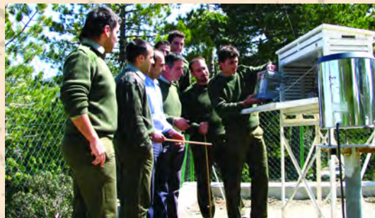
Πρακτική εξάσκηση στο μάθημα της Μετεωρολογίας

Το υπόλοιπο προσωπικό του Κολεγίου αποτελείται από το οικιακό, το γραμματειακό, το προσωπικό του λογιστηρίου και του Κολεγιακού Δάσους.