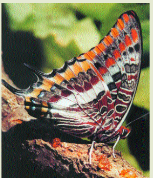
Πεταλούδα- Charaxes jasius

Εξέχουσα θέση κατέχουν οι “βασίλισσες” όλων των εντόμων, οι πεταλούδες που ανήκουν στην τάξη των λεπιδοπτέρων. Ιδιαίτερα αγαπητές, σύμβολα ζωής και μορφιάς, συνυφασμένες με την άνοιξη και τα πολύχρωμα λουλούδια προκαλούν το ενδιαφέρον των μελετητών. Υπάρχουν 52 είδη πεταλούδων στο τόπο μας από τα οποία 9 είναι ενδημικά.