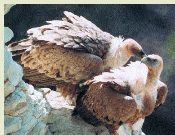
Γύπας- Gyps fulvus

Τα πουλιά που έχουν κατα-γραφεί μέχρι σήμερα στην Κύπρο ανέρχονται σε 370 είδη. Από αυτά 53 είναι