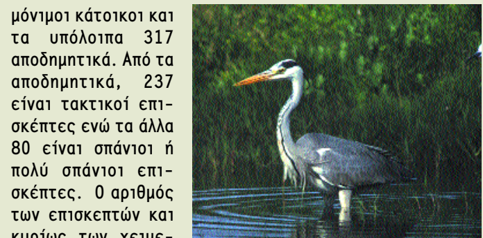
Γκρίζος ερωδιός- Ardea cinerea

μόνιμοι κάτοικοι και τα υπόλοιπα 317 αποδημητικά. Από τα αποδημητικά, 237 είναι τακτικοί επι-σκέπτες ενώ τα άλλα 80 είναι σπάνιοι ή πολύ σπάνιοι επι-σκέπτες. Ο αριθμός των επισκεπτών και κυρίως των χειμε-ρινών, ποικίλλει από χρόνο σε χρόνο και εξαρτάται από τις κλιματικές συνθήκες στη Βόρεια και Ανατολική Ευρώπη αλλά και τις βροχοπτώσεις στην Κύπρο.