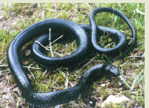
Μαύρο φίδι- Coluber jugularis

στο πάνω μέρος είναι σκούρο γκριζό ή μαύρο ενώ η κοιλιά του μπορεί να είναι γκριζα, κίτρινη ή άσπρη. Το φίδι αυτό δεν έχει δηλητήριο και τρέφεται με σαύρες. Αναγνωρίστηκε ως ξεχωριστό είδος το 1983.