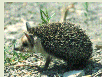
Σκαντζόχοιρος- Hemiechinus auritus dorotheae

Ο Σκαντζόχοιρος ( Hemiechinus auritus dorotheae ) ενδημικό υποείδος, ζώο ντροπαλό που πληρώνει κάθε χρόνο βαρύ φόρο αίματος στην άσφαλτο, κυρίως την άνοιξη και το καλοκαίρι. Κοινό στις χαμηλές