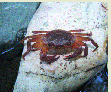
Κάβουρας του γλυκού νερού- Potamon potamius