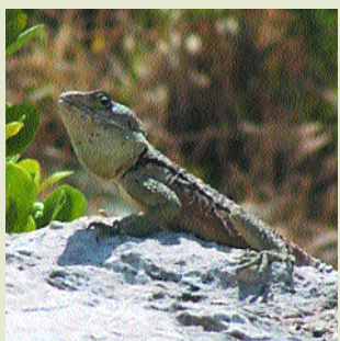
Κουρκουτάς- Laudakia stellio cypriaca

Το ενδημικό κυπριακό Φίδι ( Coluber cypriensis ) απαντά κυρίως στο δάσος Πάφου καθώς και σε μερικά άλλα μέρη της επαρχίας Πάφου. Έχει μακρύ και λεπτό σώμα, μήκους γύρω στα 75 cm. Το χρώμα του