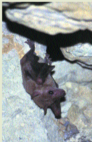
Νυκτοπάπαρος- Rousettus aegyptiacus

Ο γοργοπόδαρος Λαγός ( Lepus europaeus cyprius ) ενδημικό υποείδος, είναι το κύριο αλλά και μεγαλύτερο θηραματικό είδος. Ζει σε όλες τις επαρχίες σε ικανοποιητικούς αριθμούς, παρά την ισχυρή πίεση που δέχεται από το εντατικό κυνήγι.