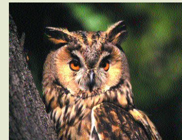
Αρκόθουπος- Asto otus

Η αποδημία είναι ένα φαινόμενο που επανα-λαμβάνεται την ίδια πε-ρίπου περίοδο κάθε χρόνο. Οι καιρικές συν-θήκες τόσο την άνοιξη όσο και το φθινόπωρο χαρακτηρίζονται από ήπιους ανέμους, άριστη