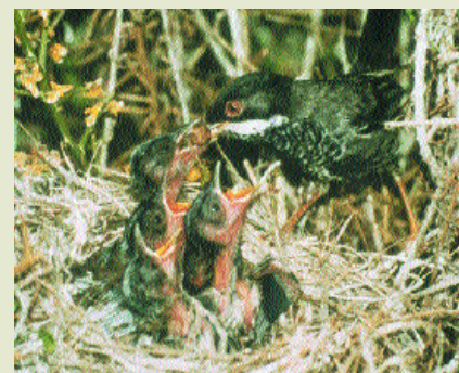
Τρυποράσινης- Sylvia melanothorax

ορατότητα και ελά-χιστη συνεφιά πρά-γμα που βοηθά τα πουλιά κατά τη διάρ-κεια της μετανά-στευσής τους από την Ευρώπη προς την καρδιά της Αφρι-κανικής Ηπείρου και αντίστροφα.