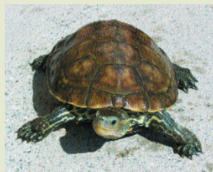
Χελώνα του γλυκού νερού- Mauremis caspica rivulata

Στις χελώνες περιλαμβάνονται 2 είδη θαλάσσιας χελώνας, η Πράσινη ( Chelonia mydas ) και η Κοινή ( Caretta caretta ), που επισκέπτονται τις αμμώδεις παραλίες του νησιού για να γεννήσουν τα αυγά τους. Το τρίτο είδος χελώνας είναι η Χελώνα του γλυκού νερού ( Mauremis caspica rivulata ) που με την αποξήρανση των υγροτόπων και το μπάζωμα των ποταμών κινδυνεύει με αφανισμό. Ζει σε ρέματα με μικρή ταχύτητα νερού πλούσια σε υδροχαρή βλάστηση, κυρίως σε περιοχές εντός και γύρω από τη Λευκωσία και την Πόλη Χρυσοχούς.